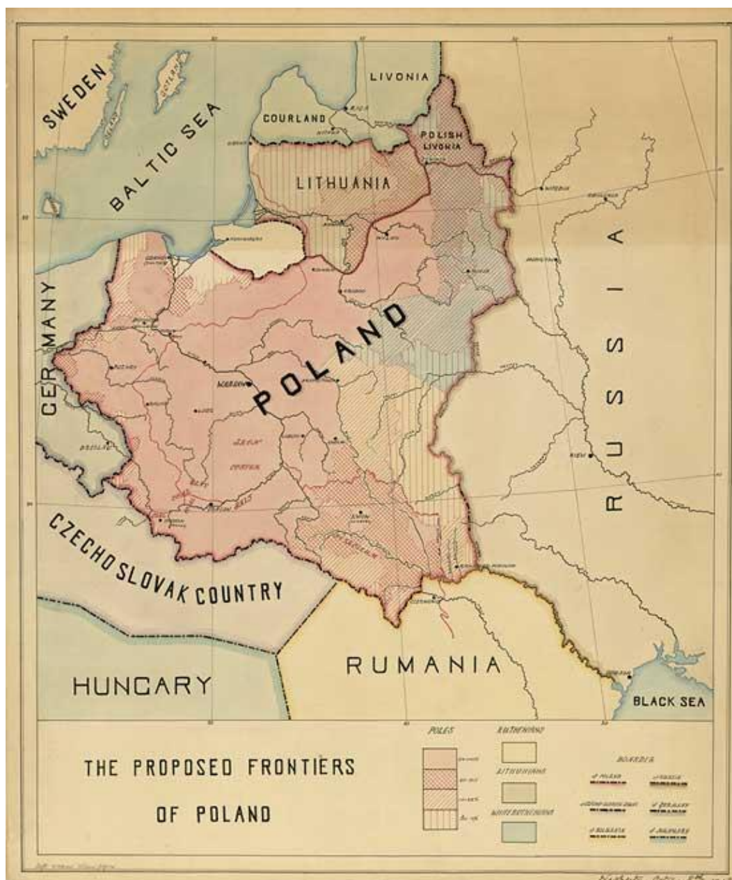
Ryc. 2. Projekt terytorium Polski przedstawiony przez polską delegację podczas konferencji w Wersalu w 1919 r.

polskie żądanie terytorialne (ryc. 2). Postulowane terytorium Polski, zwłaszcza w części zachodniej i północnej, było w ówczesnych uwarunkowaniach politycznych, mało prawdopodobne do urzeczywistnienia. Nie udało się przeforsować m.in. propozycji dotyczących Śląska Opolskiego i całości Górnego Śląska, ponadto Warmii i Mazur, Gdańska czy szerszego dostępu do Bałtyku. Również ustalona ostatecznie w wyniku wojny polsko-bolszewickiej granica na wschodzie, była mniej korzystna, niż zaproponowana przez R. Dmowskiego. Natomiast do sukcesów niewątpliwie należy zaliczyć uzyskanie terytorium większego niż ówczesny polski obszar etniczny, dostępu do morza oraz części Górnego Śląska (Eberhardt 2015).